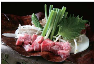
朴葉味噌ステーキ Houbamiso Steak