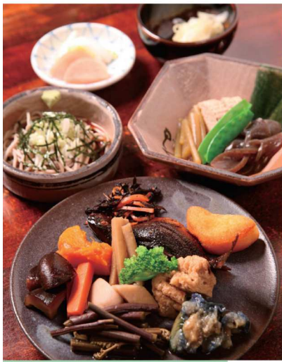
飛驒の食材を使用した料理 Local meals of Hida-Takayama

"Sansai Teishoku" or wild plants table d'hôte with much mountain and fluvial products, "Houbamiso" or pastoral miso, "Shabu-Shabu" and "Misotakinabe" or selected vegetables and meat served in the hot pot, and other kinds of Hida dishes elaborately relished to each season -- we are looking forward to serving you with these dishes.