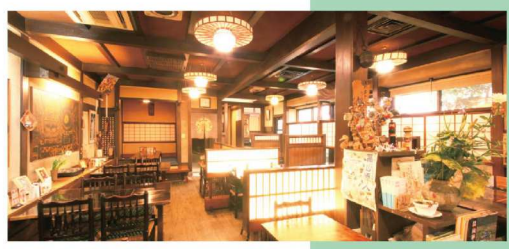
高山の古民家を再現した店内 The shop which reproduced the old private house of the Hida-Takayama