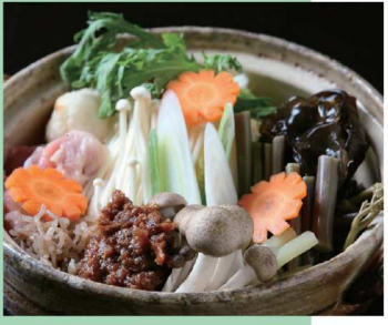
山菜味噌鍋 Edible wildplant Misonabe

高山の古民家を再現した格調ある雰囲気と心をこめた料理で楽しいひとときをお過ごしください